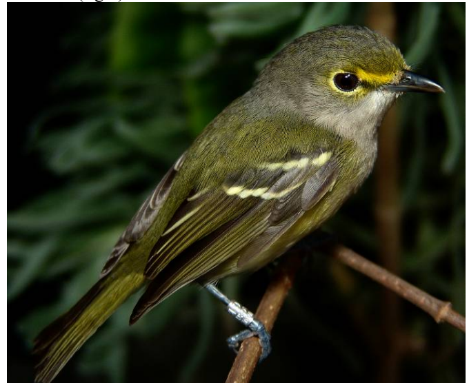
White-eyed Vireo Vireo griseus on San Andres; juvenile (left) and adult (right).

(12°32’57”N; 81°43’09”W) (one on 25 May 2004 (adult), 27 October 2005 (juvenile) and 1 November 2005 (juvenile): Shary Rodríguez, Andrea Pacheco, Paul Salaman & Alonso Quevedo); Red Crab (12.30’12”N; 81.43’02”W) (one on 22 October 2006: Marcela Salguero and Gustavo Suárez); and Estación ‘Aquí Es Más Allá’ (12°30’N; 81°43’W) (two on 2 December 2006). The species breeds in south-eastern USA and northern Mexico, wintering south to Nicaragua with records south to Panama and across much of the Caribbean (Howell & Webb 1995, Raffaele et al. 1998), thus its appearance in San Andrés is expected. The species appears to be a regular winter visitor to the island.