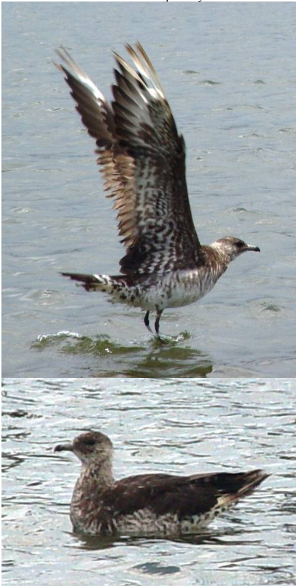
Pomarine Skua in Bahía de Cispatá.

northern South America (Restall et al. 2006) and an “uncommon migrant” throughout the Caribbean (Raffaele et al. 1998). Photographic confirmation of this species in Colombia is therefore long overdue.