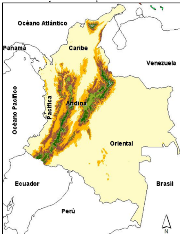
Figura 1. Eco-regiones biogeográficas de Colombia

De forma preocupante, el número de especies amenazadas en Colombia ha aumentado en forma constante, en varias especies por año. Hasta el momento, una especie y por lo menos una subespecie endémicas de Colombia se han extinguido globalmente, al parecer. Sólo hasta ahora se ha hecho conciencia de la gravedad de los problemas ambientales de Colombia, pero se tiene la esperanza de que las aves estimulen la conservación de la biodiversidad y los hábitats prístinos de Colombia.