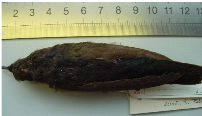
Blue-mantled Thornbill Chalcostigma stanleyi specimen at BMNH

A specimen in the Natural History Museum, Tring, UK (BMNH 2002.3.756) accessioned in 1819 is labelled “Colombia” and likely comes from the south of the country. The species is otherwise known from Ecuador, where it is considered uncommon and local in páramo habitats (Restall et al. 2006). This species is of similar status to Imperial Snipe Gallinago imperialis and Bogota Sunangel Heliangelus zusii , known in Colombia only from ‘Bogotá’ or ‘Colombia’ skins. The skin was discovered by Paul Salaman, Robert Prÿs-Jones and Nigel Cleere during work by Project BioMap ( www.biomap.net ).